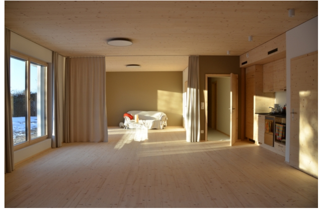
Innenansicht des Untergeschosses