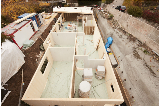
Untergeschoss während der Bauphase